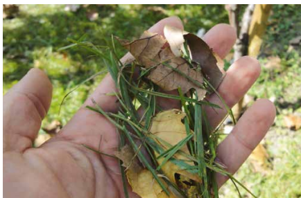
Résultat: un produit de coupe finement haché