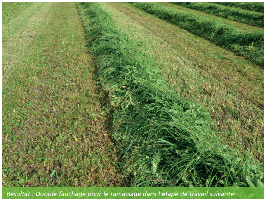
Résultat : Double fauchage pour le ramassage dans l'étape de travail suivante