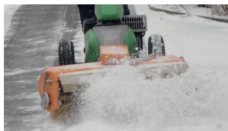
Balayage avec un système ouvert

Si on utilise la balayeuse combinée sans collecteur de déchets, le système ouvert déblaie la poussière, les déchets ou la neige vers l'avant. La brosse latérale transporte les déchets sur le côté. En passant plusieurs fois, un balayage de grandes surfaces est aussi possible sans collecteur de déchets.