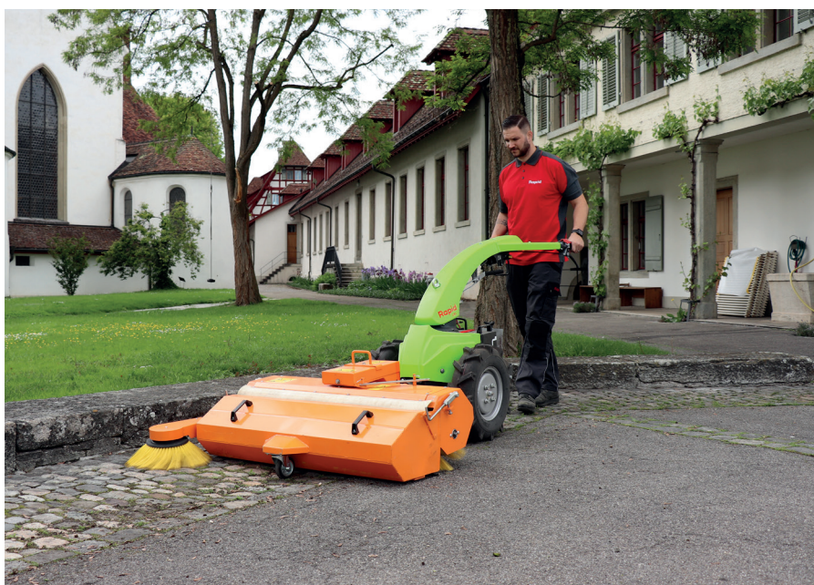
Résultat: une propreté agréable et plaisante