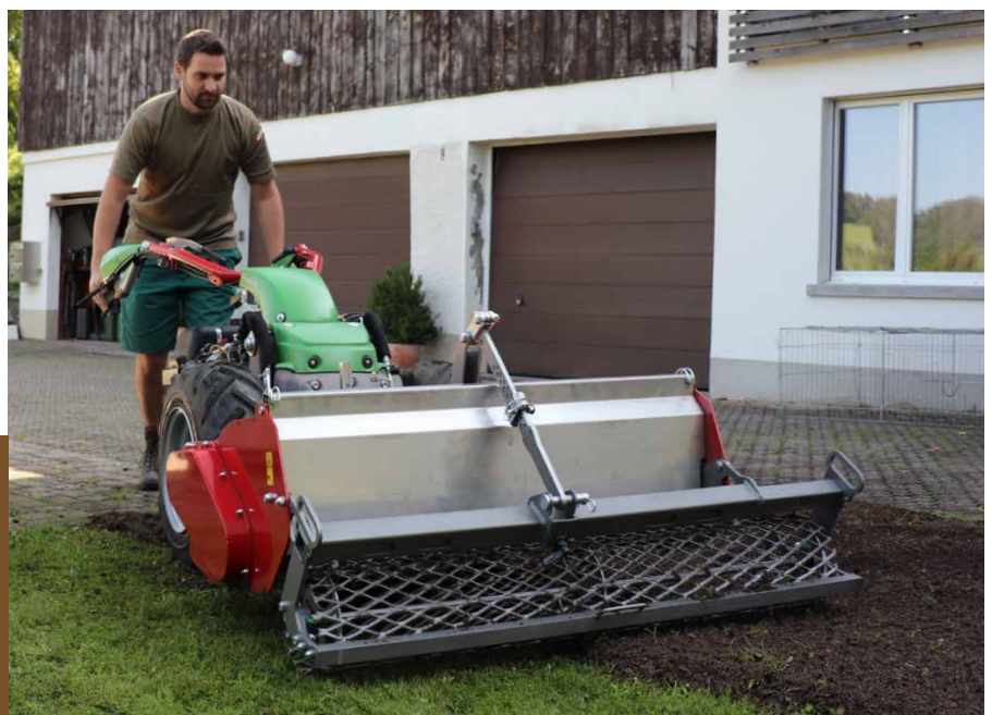
Relevage rapide en marche avant