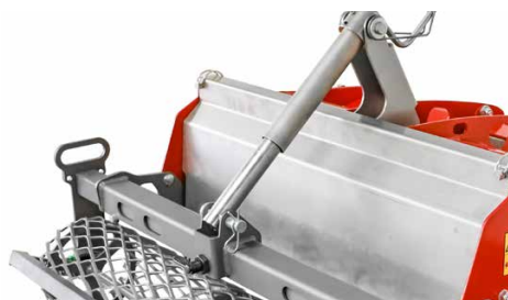
Tige en option pour le réglage en hauteur du rouleau suiveur

La profondeur de travail est définie par le réglage du rouleau suiveur. Elle peut être réglée facilement et de manière continue à l'aide de la tige manuelle en option.