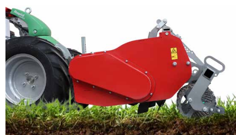
Relevage rapide position de déplacement

Le système de relevage rapide (RQL) et l'enclenchement du rouleau suiveur facilitent le repositionnement et assurent un flux de travail ininterrompu. Cette conception révolutionne le flux de travail et rend le fraissage encore plus efficace. Le RQL s'active de manière intuitive par le relevage et l'avance pour assurer un flux de travail fluide.