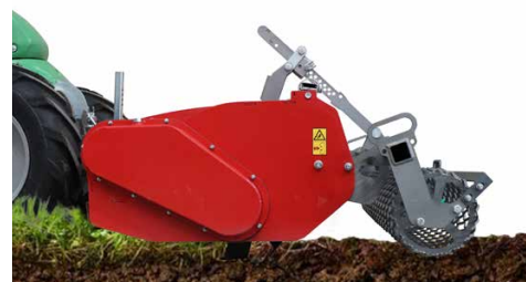
Relevage rapide position de travail