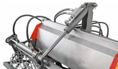
Réglage en hauteur et latéral hydraulique du rouleau suiveur en option