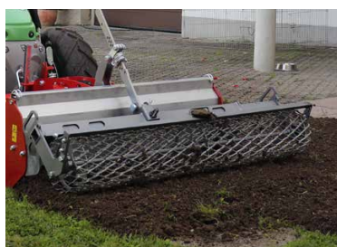
Pour enfouir le vieux gazon en une seule opération

Possibilité d'utilisation secondaire comme fraise à terre tractée Le râteau de l'enfouisseuse se démonte sans outils, indépendamment du déflecteur. L'enfouisseuse peut ainsi assurer la fonction de fraise à terre tractée et permet une utilisation polyvalente.