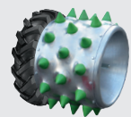
Combinaison de roues