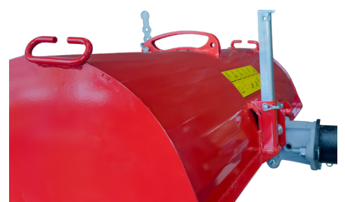
Deck, Stutzen und Abbaustütze

Der Durchfluss ist bei weit eingestelltem Deck am grössten.