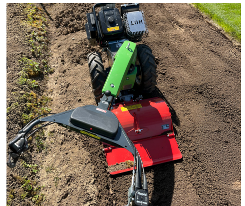
Holm seitlich verstellt

Die Bodenfräse wird mit gedrehtem Holm, also zwischen Geräteträger und Bedienperson, betrieben. Aus diesem Grund ist bei dieser Anwendung die Balance entscheidend und beeinflusst das Handling der Gesamtkombination entscheidend.