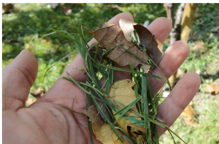
Résultat: un produit de coupe finement haché