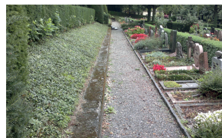
Chemins en gravier concassé, gravier et gravillon