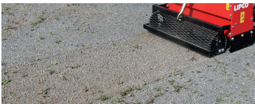
Résultat: Les plantes arrachées reposent sur des couches intactes.

Après l'élimination des mauvaises herbes, le matériel végétal repose librement sur la surface. Il est possible de le rassembler, le ramasser et l'évacuer lors d'une autre étape.