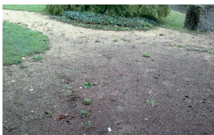
Cours constituées de grèves hydrauliques