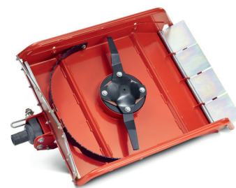
Robusta lama in acciaio dello spessore di 8 mm

Grazie alla trazione in continuo dei portattrezzi mono-asse Rapid, i lavori manuali di successiva pulizia praticamente vengono del tutto eliminati. Questo perché la macchina può essere avvicinata senza problemi e con precisione millimetrica agli ostacoli senza bisogno della frizione. Grazie alla scelta flessibile di diverse varianti di pneumatici del portattrezzi mono-asse è possibile pacciamare anche pendii ripidi in modo sicuro e accurato.