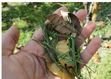
Risultato: pacciamato finemente trinciato