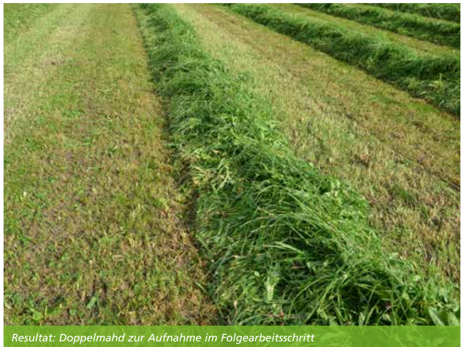
Resultat: Doppelmahd zur Aufnahme im Folgearbeitsschritt