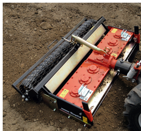
Regolazione in continuo della profondità di lavoro tramite mandrino manuale

Easy Control La profondità di lavoro viene determinata tramite il rullo griglia. Questa può essere regolata facilmente e in modo continuo mediante un mandrino manuale.