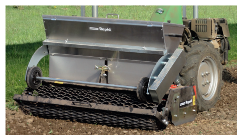
Erpice rotante universale con contenitore semina

Numerose coppie di rebbi, robuste e con rotazione orizzontale, fresano finemente il terreno. Il rullo griglia regolabile in altezza e la lama livellatrice consentono di uniformare accuratamente rilievi e avvallamenti. Il terreno finemente sbriciolato riceve, con la lavorazione, più ossigeno, le masse organiche si decompongono più velocemente e costituiscono una premessa ottimale per una crescita veloce. È possibile montare un contenitore semina opzionale direttamente sull'erpice rotante universale. Aree verdi, campi o giardini di nuova creazione vengono perfettamente ammorbiditi, livellati e seminati.