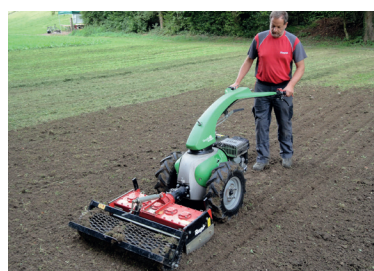
Semplice utilizzo delle macchine Rapid

Le combinazioni di attrezzi Rapid sono di facile e sicuro utilizzo. Grazie alla trasmissione a variazione continua e agli impianti sterzanti attivi, il lavoro fisico è notevolmente semplificato e allo stesso tempo l'efficienza è aumentata.