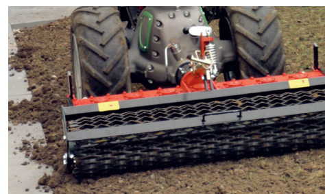
Lavorare senza problemi fino agli ostacoli

Il sistema di trazione compatto si trova sopra le coppie rotanti. Con l'erpice rotante universale è così possibile lavorare direttamente lungo muri, cordoli dei marciapiedi o altri ostacoli. In questo modo si elimina la necessità di eseguire noiosi lavori manuali.