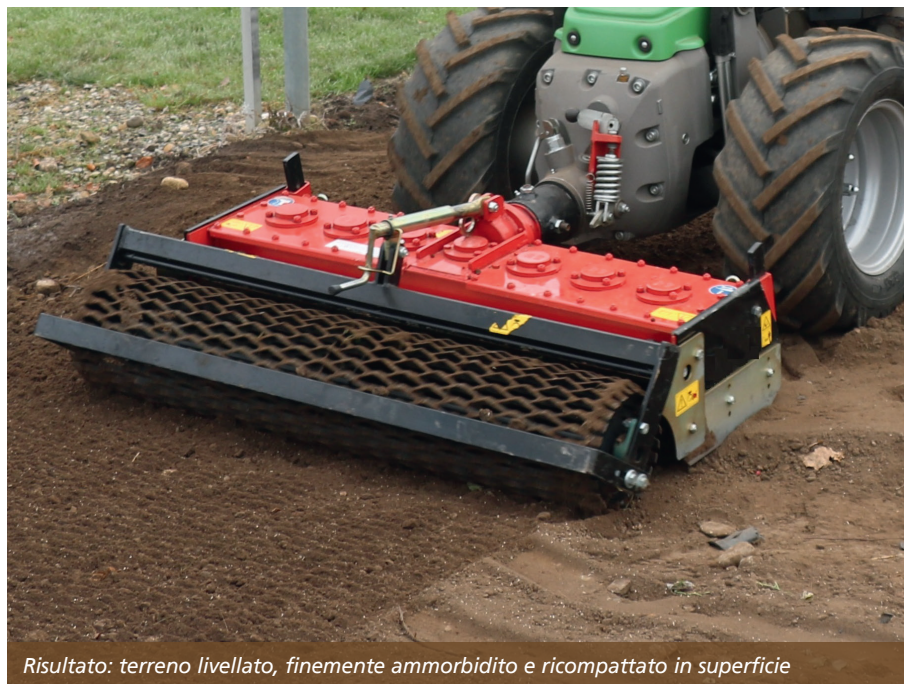
Risultato: terreno livellato, finemente ammorbidito e ricompattato in superficie