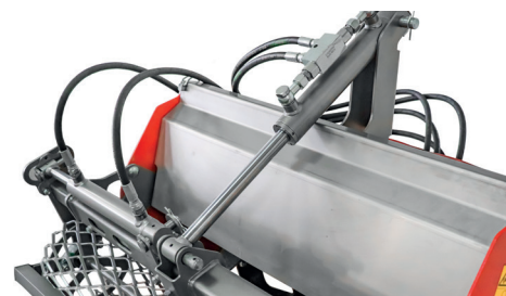
Regolazione idraulica opzionale dell'altezza e laterale del rullo posteriore

Comoda regolazione dell'altezza e laterale durante l'utilizzo mediante il pulsante del sistema idraulico supplementare sul manubrio. Ciò è possibile senza lasciare il manubrio.