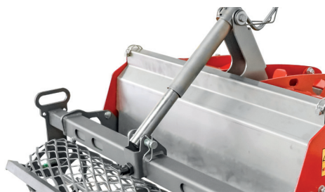
Mandrino opzionale per la regolazione dell'altezza del rullo posteriore

La profondità di lavoro viene determinata spostando il rullo posteriore. Tale rullo è regolabile in modo semplice e continuo mediante il mandrino manuale opzionale.