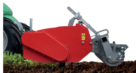
Sollevamento rapido, posizione di lavoro