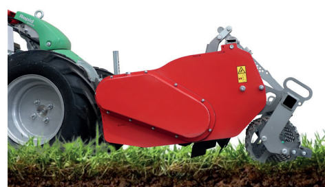
Sollevamento rapido, posizione di trasferimento

Il sollevamento rapido (RQL) e l'aggancio del rullo posteriore garantiscono un'eccellente facilità di inserimento e un flusso di lavoro ininterrotto. Questo rivoluziona il flusso di lavoro e rende la fresatura ancora più efficiente. L'RQL viene attivato in modo intuitivo tramite il sollevamento e l'avanzamento a marcia avanti, consentendo un flusso di lavoro fluido.