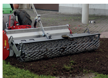
Fresare il vecchio prato in un'unica operazione

Il rastrello sulla fresa interrassassi può essere smontato senza attrezzi, indipendentemente dalla lamiera deflettrice. Pertanto, la fresa interrassassi può essere utilizzata anche come motozappa trainata e consente un uso versatile.