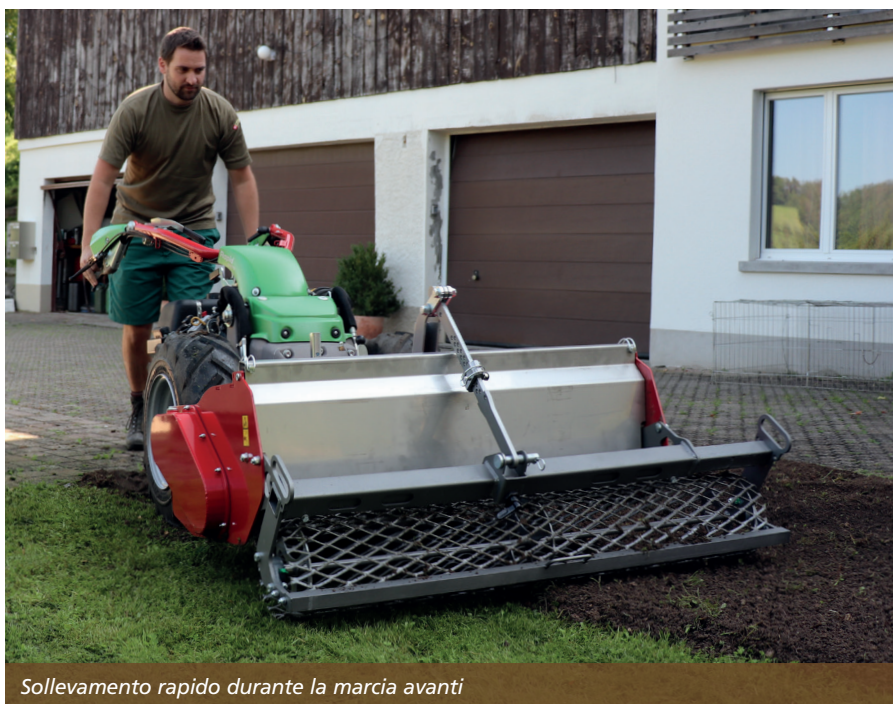
Sollevamento rapido durante la marcia avanti