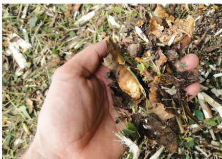
Resultat: fein gehäckseltes Schnittgut