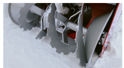
Robuste Bauweise für harte Einsätze und lange Lebensdauer