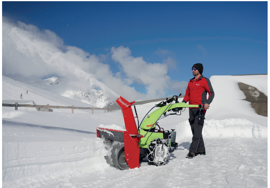
Resultat: sicheres Durchkommen nach professioneller Schneeräumung

Aufgrund des niedrigen Gesamtgewichts und ihrer geringen Abmessungen sind Rapid Geräte problemlos mit z.B. Bergbahnen zu abgelegenen Bestimmungsorten transportierbar.