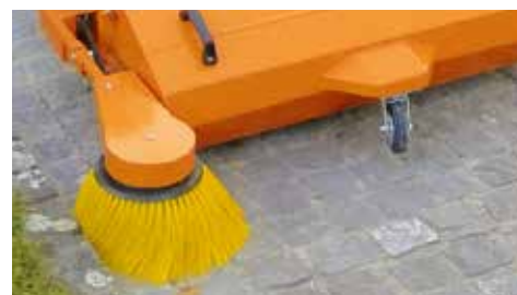
Spazzola laterale per una pulizia impeccabile