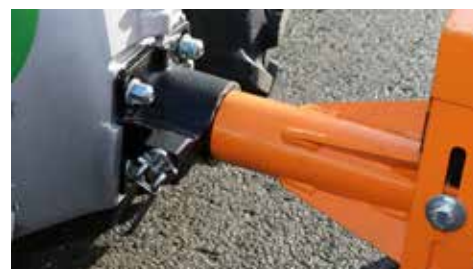
Attacco rapido senza attrezzi

Le macchine Rapid necessitano di pochissimo tempo per essere pronte all'uso. Grazie al sistema di attacco senza attrezzi, è possibile cambiare attrezzi da lavoro in modo veloce e comodo.