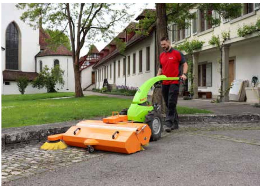
Risultato: una pulizia gradevole e invitante