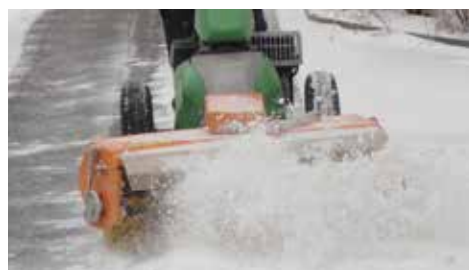
Spazzolare con il sistema aperto

Se la spazzatrice combinata viene impiegata senza contenitore raccogli-sporco, il sistema aperto spazzola polvere, sporco o neve trasportandoli in avanti. La spazzola posta lateralmente trasporta lo sporco lateralmente. Con più passate parallele è possibile lo spazzamento anche di spazi più grandi senza contenitore raccogli-sporco.