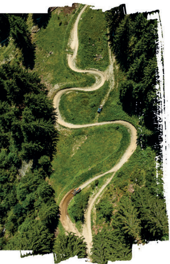
Le D501 puissant en train de «shaper» un trail de VTT.

Le Rapid RoboFlail Vario D501 est le porte-outils le plus fort de la série RoboFlail.