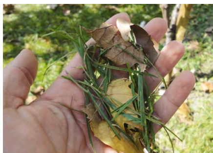
Risultato: pacciamato finemente trinciato