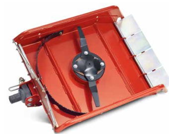
Robusta lama in acciaio dello spessore di 8 mm

Grazie alla trazione in continuo dei portattrezzi mono-asse Rapid, i lavori manuali di successiva pulizia praticamente vengono del tutto eliminati. Questo perché la macchina può essere avvicinata senza problemi e con precisione millimetrica agli ostacoli senza bisogno della frizione. Grazie alla scelta flessibile di diverse varianti di pneumatici del portattrezzi mono-asse è possibile pacciamare anche pendii ripidi in modo sicuro e accurato.