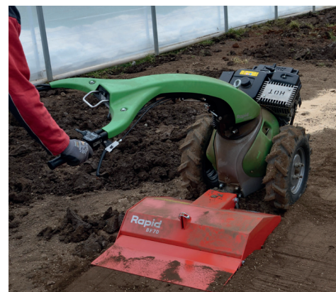
Manubrio regolato lateralmente