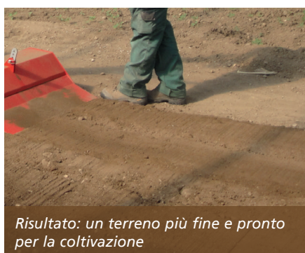
Risultato: un terreno più fine e pronto per la coltivazione