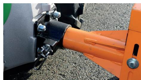
Attacco rapido senza attrezzi

Le macchine Rapid necessitano di pochissimo tempo per essere pronte all'uso. Grazie al sistema di attacco senza attrezzi, è possibile cambiare attrezzi da lavoro in modo veloce e comodo.