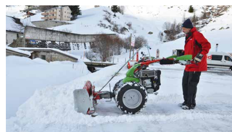
Potenza e comfort maggiori durante lo sgombero di grandi quantità di neve grazie ai pannelli laterali.