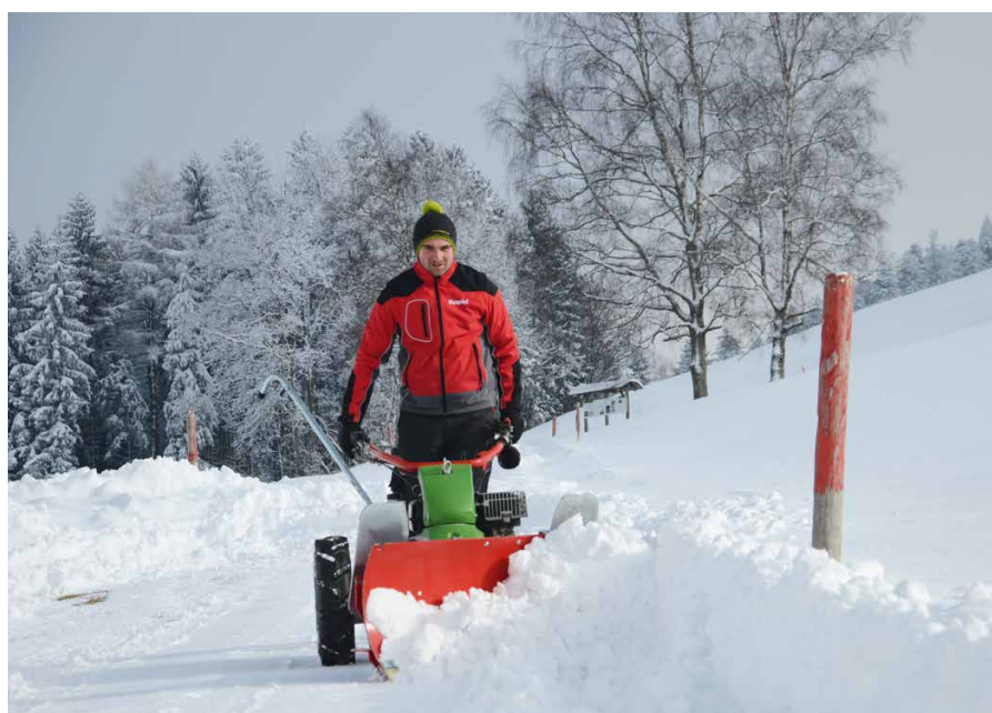
Risultato: sicurezza grazie allo sgombero professionale della neve