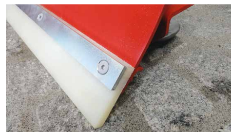
Barra in vulkolan

Per sgomberare in modo efficiente superfici più grandi sono disponibili dei pannelli laterali opzionali. Questi evitano che la neve si riversi dai lati sullo spartineve. È possibile spostare anche maggiori volumi di neve su distanze più lunghe nella direzione di marcia.