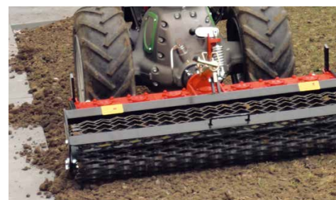
Lavorare senza problemi fino agli ostacoli

Il sistema di trazione compatto si trova sopra le coppie rotanti. Con l'erpice rotante universale è così possibile lavorare direttamente lungo muri, cordoli dei marciapiedi o altri ostacoli. In questo modo si elimina la necessità di eseguire noiosi lavori manuali.