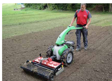
Semplice utilizzo delle macchine Rapid

Le combinazioni di attrezzi Rapid sono di facile e sicuro utilizzo. Grazie alla trasmissione a variazione continua e agli impianti sterzanti attivi, il lavoro fisico è notevolmente semplificato e allo stesso tempo l'efficienza è aumentata.