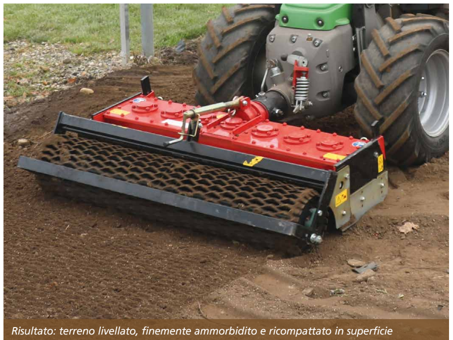
Risultato: terreno livellato, finemente ammorbidito e ricompattato in superficie