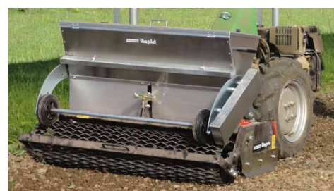
Erpice rotante universale con contenitore semina

rullo griglia regolabile in altezza e la lama livellatrice consentono di uniformare accuratamente rilievi e avvallamenti. Il terreno finemente sbriciolato riceve, con la lavorazione, più ossigeno, le masse organiche si decompongono più velocemente e costituiscono una premessa ottimale per una crescita veloce. È possibile montare un contenitore semina opzionale direttamente sull'erpice rotante universale. Aree verdi, campi o giardini di nuova creazione vengono perfettamente ammorbiditi, livellati e seminati.