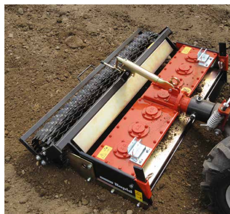
Regolazione in continuo della profondità di lavoro tramite mandrino manuale

Easy Control La profondità di lavoro viene determinata tramite il rullo griglia. Questa può essere regolata facilmente e in modo continuo mediante un mandrino manuale.