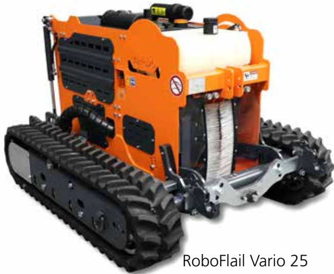
RoboFlail Vario 25