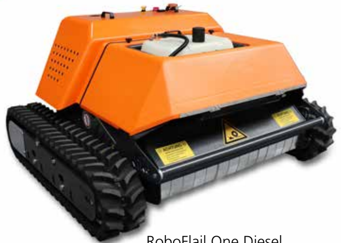
RoboFlail One Diesel