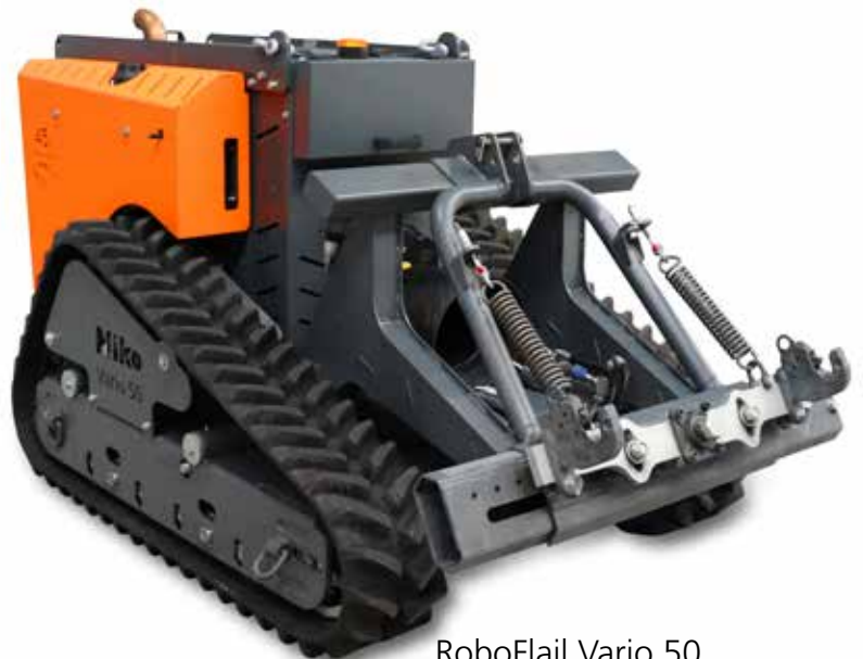
RoboFlail Vario 50